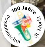
Posaunenchor St. Moritz