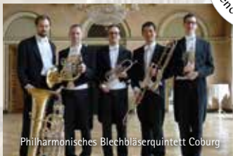
Philharmonisches Blechbläserquintett Coburg